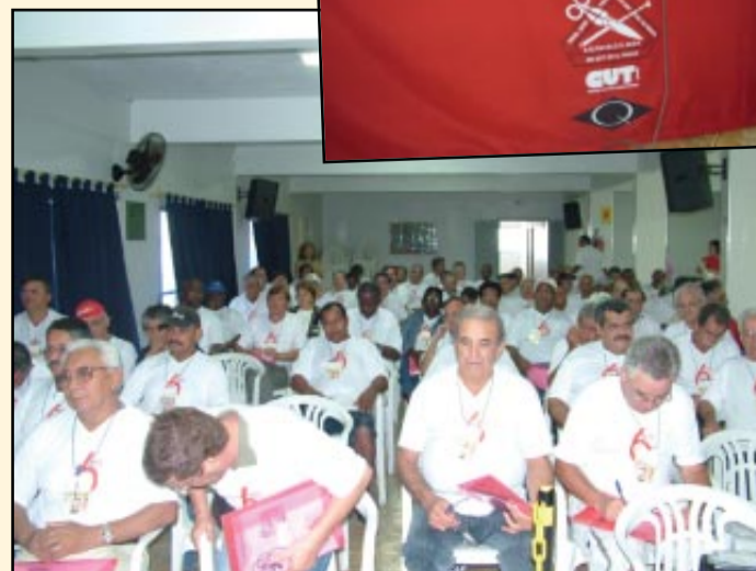
Matanto a saudade e vivendo a vida