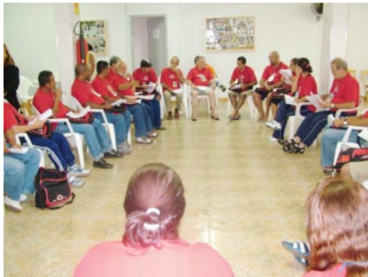
Seriedade nas discussões em grupo

para isso se viabilizar fosse cobrada uma taxa um pouco maior. Organizar uma Biblioteca para incentivar a leitura e melhorar o nível de informação dos sócios e seus dependentes.