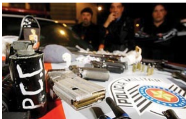
Na foto só faltam os cadáveres do IML

Não passa um dia sem que nas notícias da TV a violência e insegurança seja tratada como o horror provocado pela população pobre contra a burguesia histórica. É horrível ser assaltado. A população da periferia é a maior vítima. O que há de igual em todos esses casos é: quem se arreventa é o povo sofrido. É o povo pobre, grande maioria jovem com baixa escolaridade, moradores da periferia. Quando os bandidos do PCC matam os policiais e em seguida os policiais saem matando e massacrando pode-se ver que todos (bandidos, policiais e as centenas de mortos ao acaso) são gente de origem pobre que nunca teve grandes oportunidades. Os bandidos foram jovens atraídos pelo ganho fácil e morte fácil do mundo do crime e das drogas. Os policiais ganham pouco, se arriscam muito e