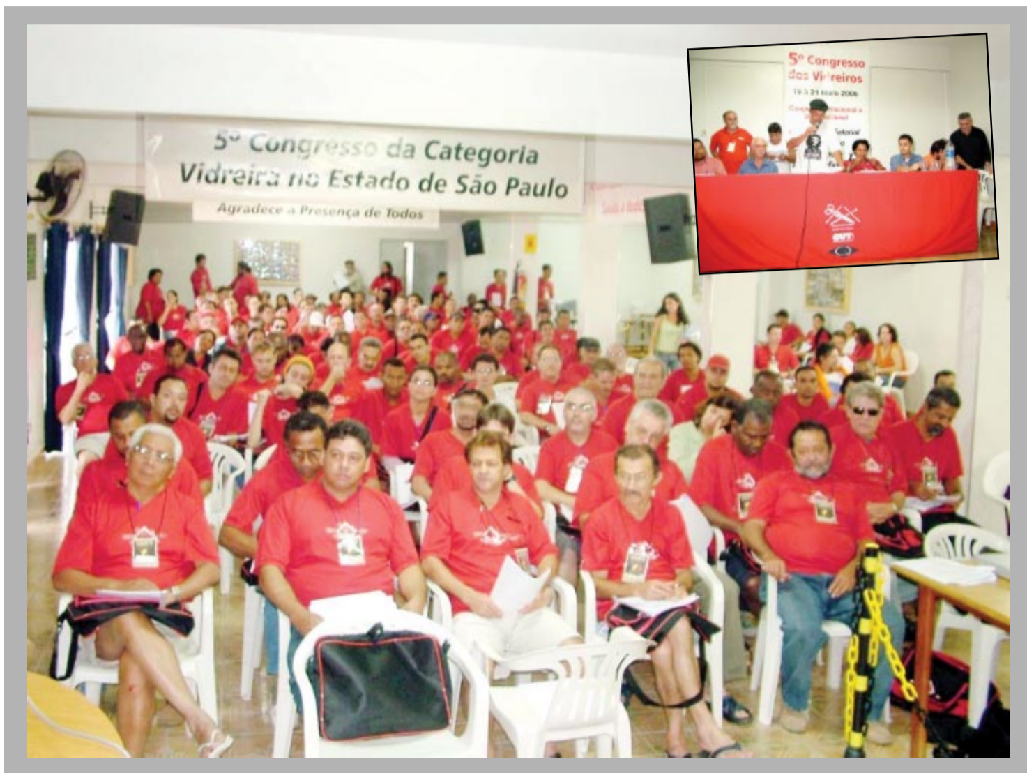
5º Congresso definiu as prioridades de luta para a categoria. Veja mais na página 3