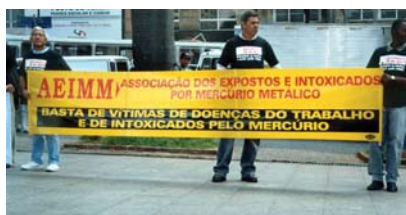
Trabalhadores na luta contra o uso do mercúrio

O mercúrio é um metal líquido na temperatura ambiente, de cor prateada, e que se evapora penetrando no corpo pela respiração. Como não tem cheiro, nem causa mal-estar súbito, as pessoas acham que ele não faz mal. Mesmo em pequenas quantidades, o mercúrio penetra no cérebro causando graves e irreversíveis problemas. Os sintomas da contaminação variam de leves até extremamente graves culminando com a morte ou deixando a saúde alterada e sem possibilidade de cura. Qualquer possibilidade de exposição a esse agente tão nocivo deve ser eliminada. Desde 1990, os trabalhadores vêm se organizando e lutando para melhorar os ambientes de trabalho e