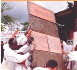
Memorial dos contaminados da Rhodia, janeiro de 1999.