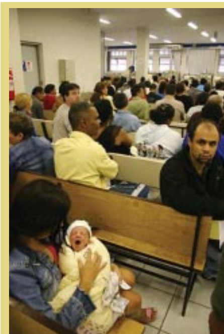
Urgência na contratação de funcionários para melhorar o atendimento

Esta medida representa mais uma grande sacanagem contra a classe trabalhadora, pois repassa para a Receita Federal os recursos que garantem o pagamento de benefícios previdenciários e retira do INSS qualquer autonomia para utilizar e gerenciar estes recursos. A médio prazo, o governo poderá justificar mais e mais cortes nos direitos previdenciários e sociais em nome de uma austeridade fiscal e para saneamento das contas públicas, já que não mais estarão em jogo o caráter