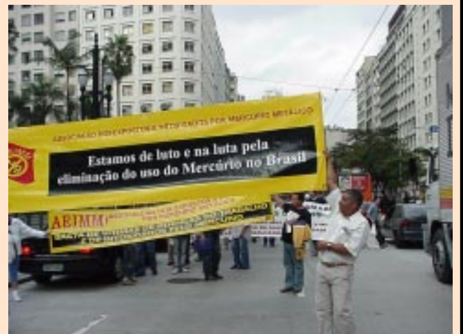
Manifestação em defesa da saúde dos trabalhadores. Em 2006, um exemplo de unidade e um BASTA à ação dos agentes nocivos no trabalho e no meio ambiente.

O mercúrio causa danos irreversíveis ao Sistema Nervoso Central (SNC), provocando alterações na memória, mudanças de comportamento, alternando quadros de ansiedade e depressão, insônia, dores musculares e de cabeça, gengivite crônica, tremores e até a morte. Em São Paulo, um dos casos mais conhecidos ocorreu na fábrica de lâmpadas Sylvania, em 1992, quando mais de uma centena de trabalhadores foram diagnosticados pelo Centro de Referência em Saúde do Trabalhador com intoxicação crônica por mercúrio.