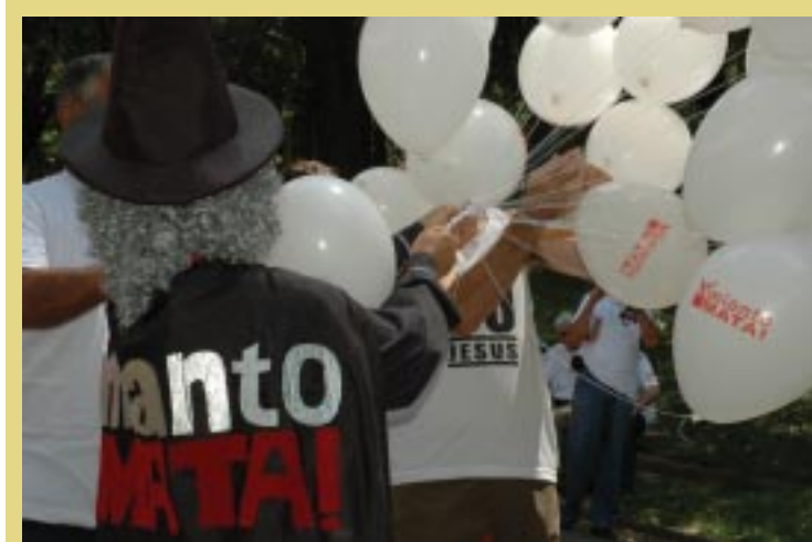
Ato de protesto contra a fibra do diabo

Aos movimentos que lutam pelo banimento do amianto e indenização das vítimas, como a Associação Brasileira dos Expostos ao Amianto (ABREA), não resta, portanto, outra saída que não seja a de promover campanhas de esclarecimento junto ao consumidor destes