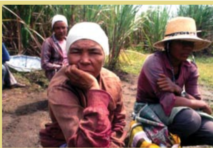
Etanol provocará tragédia ao transformar o Brasil numa grande Roça de cana!

O ritmo do trabalho é alucinante, o pagamento uma merreca e as condições desumanas. Até os jornais que normalmente não estão nem aí pra situação do trabalhador, andam falando sobre isso. Na região de Ribeirão Preto, uma das mais ricas do Brasil, tem acontecido barbaridades. Várias