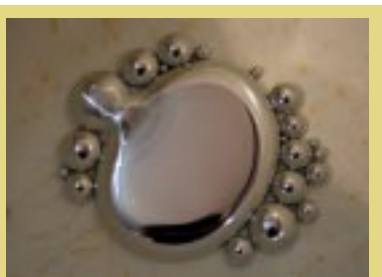
Mercúrio: mal que precisa ser erradicado

problemas para conseguir manter o atendimento e tratamento aos trabalhadores contaminados por mercúrio nos poucos serviços de saúde especializados em diagnosticá-lo e tratá-lo, como é o caso do Centro de Referência em Saúde do Trabalhador e o Serviço de Saúde Ocupacional / Hospital das Clínicas (SSO/HC).