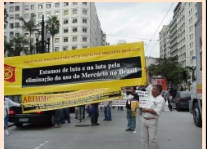
Manifestação em defesa da saúde dos trabalhadores. Em 2006, um exemplo de unidade e um BASTA à ação dos agentes nocivos no trabalho e no meio ambiente.

O mercúrio causa danos irreversíveis ao Sistema Nervoso Central (SNC), provocando alterações na memória, mudanças de comportamento, alternando quadros de ansiedade e depressão, insônia, dores musculares e de cabeça, gengivite crônica, tremores e até a morte. Em São Paulo, um dos casos mais conhecidos ocorreu na fábrica de lâmpadas Sylvania, em 1992, quando mais de uma centena de trabalhadores foram diagnosticados pelo Centro de Referência em Saúde do Trabalhador com intoxicação crônica por mercúrio.