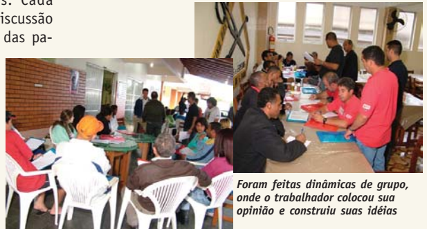
Foram feitas dinâmicas de grupo, onde o trabalhador colocou sua opinião e construiu suas idéias

Aliás, talvez até possamos um dia fazer de cada trabalhador um agente de mudança, um agente para lutar por muitas outras necessidades da vida dos explorados. ■