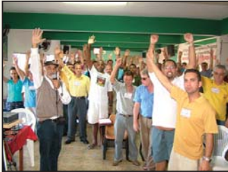
Aprovação do Comitê de Saúde

O Segundo Encontro Estadual de Saúde do trabalhador vidreiro 2005, realizado nos dias 8, 9 e 10 de julho, na Colônia de Férias - Praia Grande, foi marcado pelo dinamismo e seriedade dos participantes.